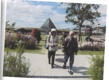
自由に外出をお楽しみ下さい。