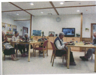
日頃のお食事風景です