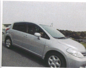
自らの運転でお出かけです