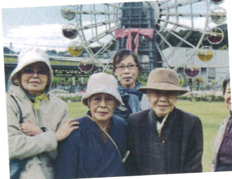
苑のレク活動に参加しました

A. 食事時間は決まっていますが、お申し出があればその時間にめしあがる必要はありません。外出、外泊は自由です。入浴は個浴です。時間は決まっていますが、その間でしたら好きな時にお入りいただけます。